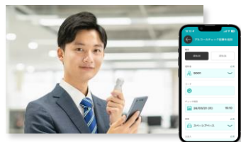
アルコールチェック記録